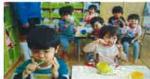
【園での歯みがきの様子】

虫歯を予防するためには、やはり歯みがきが一番大切です。お子さまが歯磨きをした後は仕上げみがきをおこない、虫歯を予防しましょう。またご飯を食べる時はしっかりと噛んで食べる習慣をつけましょう。肥満予防となるだけでなく、唾液がたくさん出ることで口の中を洗い流し、むし歯を防いでくれる役割があります。園では、事故防止のために歯ブラシをもってふざけたり、口に入れたまま歩かないなど指導しています。