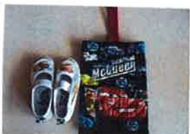
←うわばき(マジックテープの物はうわばき入れ やめて下さい )